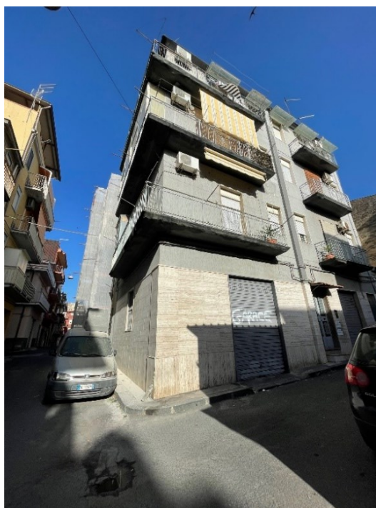
Prospetti nord e ovest dell'edificio in cui si trova l'appartamento pignorato al piano primo