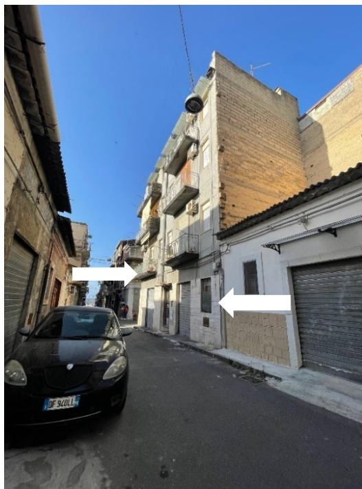
Contesto urbano in cui si trovano l'appartamento al piano primo e il garage, indicati con frecce