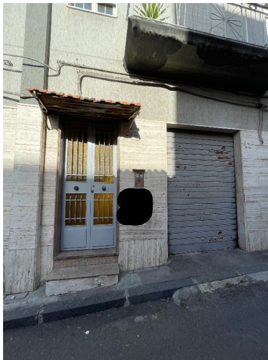
Ingressi all'edificio plurifamiliare e al garage