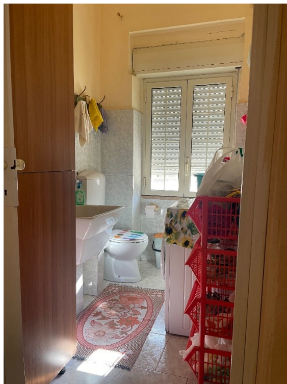
Wc - Lavanderia