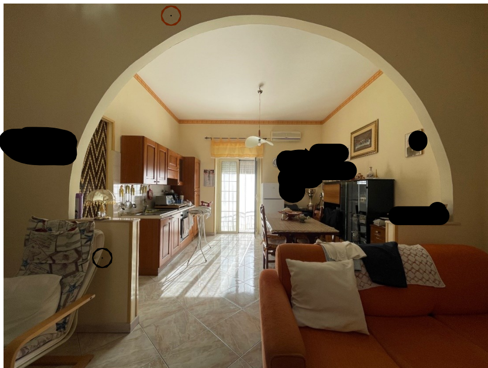
Cucina pranzo soggiorno